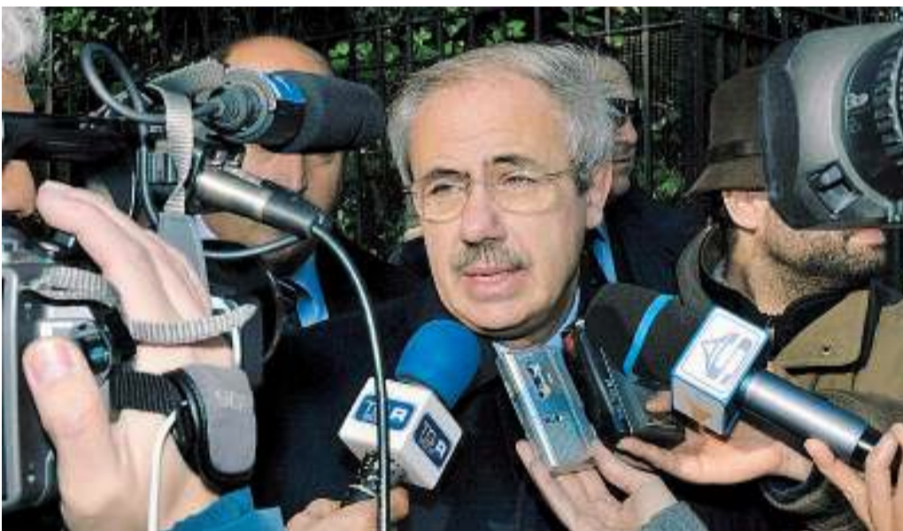
Il governatore Raffaele Lombardo

Lombardo: "La giunta non si tocca mai più un'alleanza con Berlusconi"