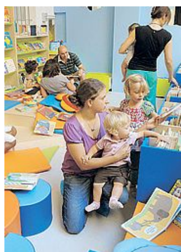
PICCOLI LETTORI Il nuovo spazio allestito alla Delfini

L'INTERVENTO, dal costo complessivo di 25mila euro, è stato fi-