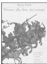
Il discusso saggio del filosofo Žižek

Il capitalismo si sta avvicinando ai suoi ultimi giorni? E dopo? Crollato il comunismo ora tocca la stessa sorte al capitalismo: ne è convinto Slavoj Žižek in questa sua ultima opera “Vivere alla fine dei tempi” (Ponte alle Grazie, editore). Žižek, che non a caso è stato definito il filosofo più pericoloso d’Occidente, sostiene che la crisi ecologica globale, i forti squilibri sociali generati dal capitalismo, le crepe nel sistema economico finanziario e la rivoluzione biogenetica rappresentino i fattori di crisi definitiva del capitali-