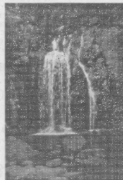
L'ingresso del pozzo di Santa Cristina. A destra, la spettacolare cascata di Los Molinos