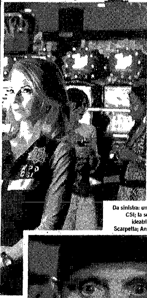
Da sinistra: una scena del telefilm culto CSI; la scrittrice Patricia Cornwell, ideatrice del personaggio di Kay Scarpetta; Anthony Hopkins - Hannibal