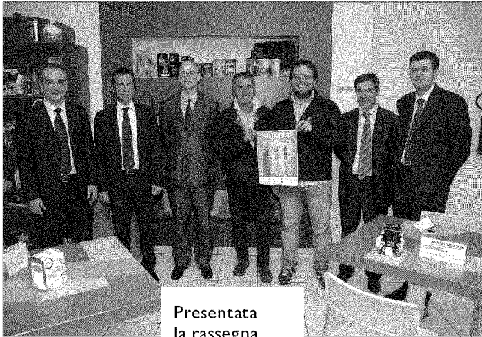
Presentata la rassegna a Forlì